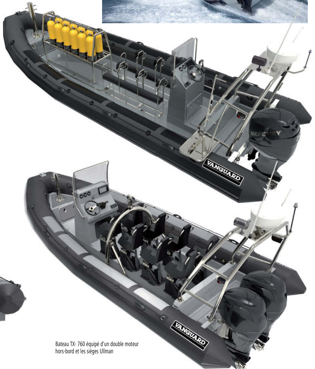
Bateau TX-760 équipé d'un double moteur hors-bord et les sièges Ullman